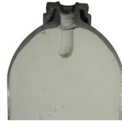
Coupe d'une bouteille de C_2H_2

Malgré le système de sécurité mentionné précédemment, une réaction de décomposition peut se produire à l'intérieur de la bouteille dans certaines circonstances défavorables.