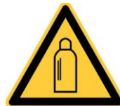
Signal de danger