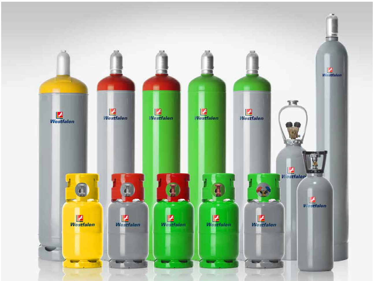
Das Kältemittelflaschen-Sortiment von Westfalen.

Weitere Informationen unter westfalen.com