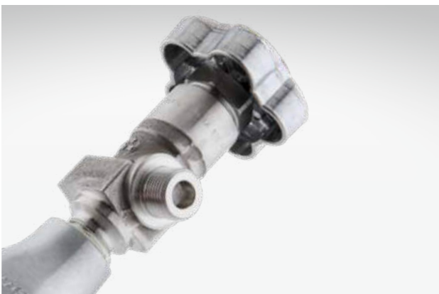
Alumini® 200 mit gasartspezifischem Gasentnahmeanschluss nach DIN 477.