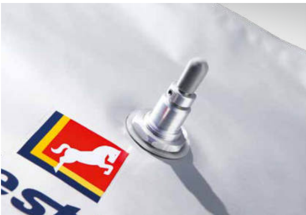
Direktanschluss mit integriertem Ventil: Schlauch mit 6 mm Innendurchmesser fixieren, kontrollierten Gasfluss durch Ventildrehung aktivieren.