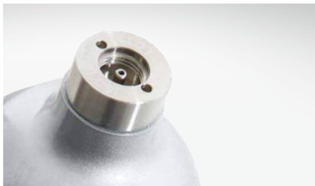
Alumini® 70 mit 5/8"-18-UNF-Ventilanschluss.