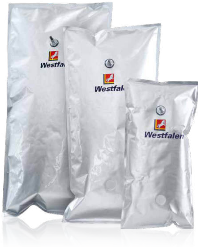
Alumini® 1-Kleingebinde in den Größen 28 l, 15 l und 5 l.