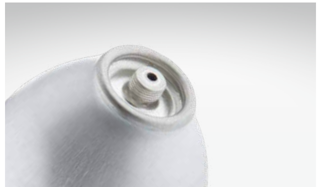
Alumini® 12 mit 7/16"-Ventilanschluss.