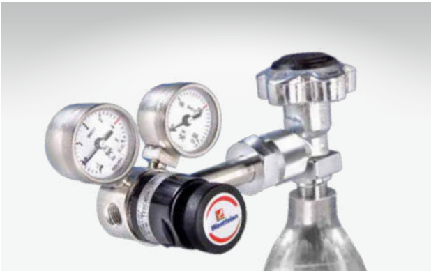
Druckminderer für inerte Gase (Abbildung ähnlich).

Die Alumini® 200 ist mit den gängigen Armaturen und DIN-Anschlüssen kompatibel. Diese Entnahmesysteme können Sie jederzeit über uns beziehen.