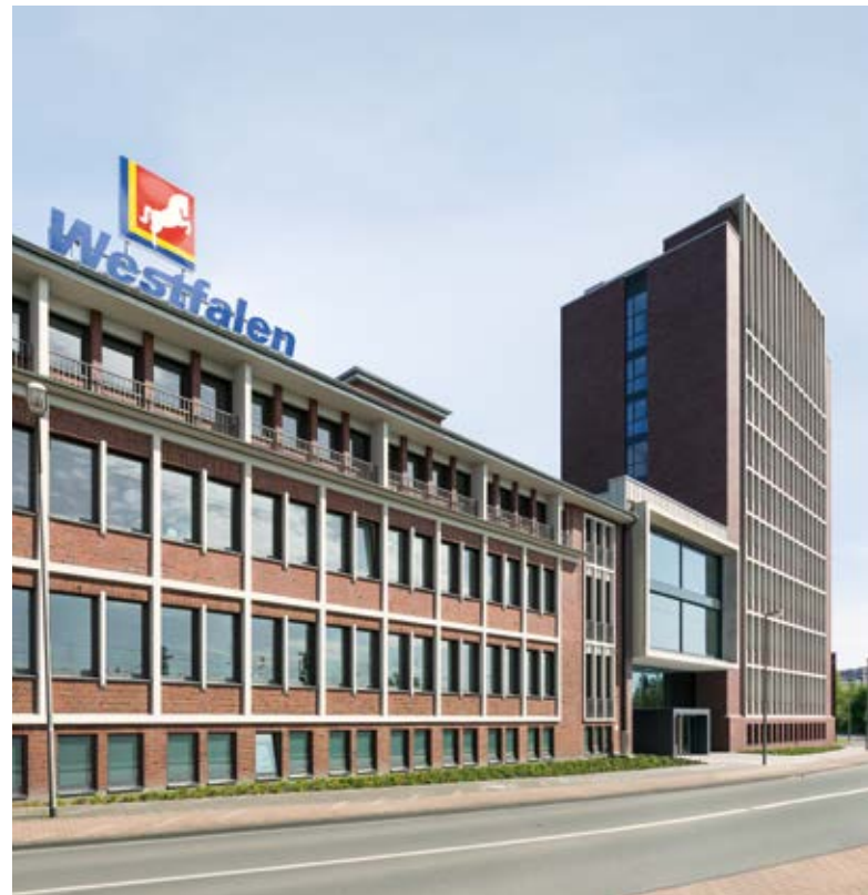
Der Hauptsitz der Westfalen Gruppe liegt am Industrieweg in Münster. Die Grafik oben links zeigt die drei Geschäftsbereiche.

Gern bringen wir uns auch für Sie in Schwung! Was dürfen wir für Sie tun?