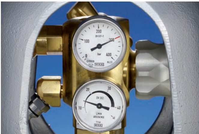
Altijd het overzicht: de geïntegreerde 300 bar manometer geeft de actuele inhoud weer.